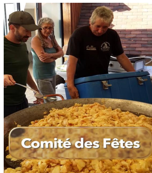
Comité des Fêtes