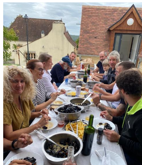
L'équipe du Comité des Fêtes Après l'effort