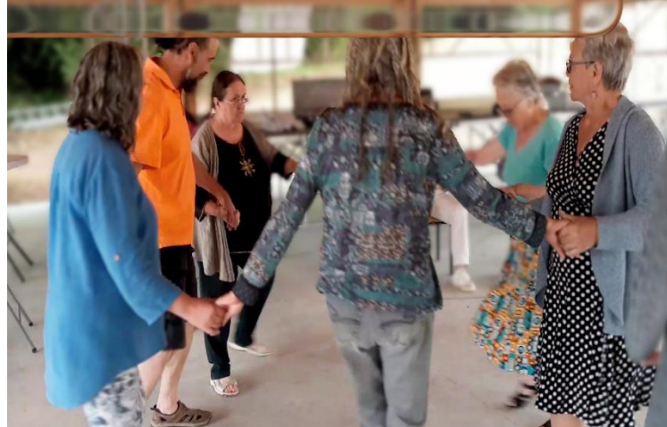
Comité des fêtes - Bal Traditionnel