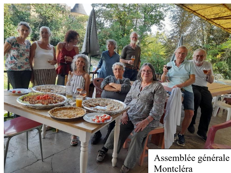
Assemblée générale du Bistrot de Montcléra