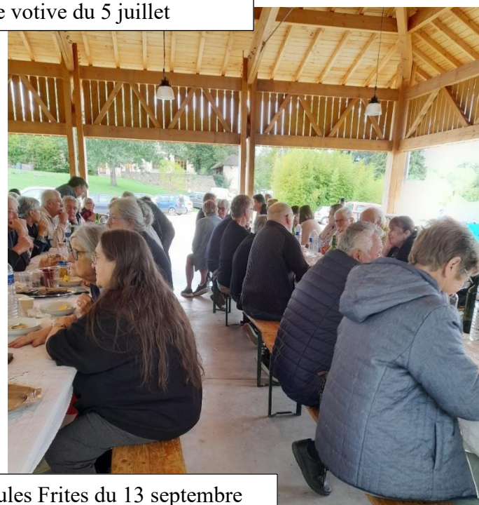
Moules Frites du 13 septembre