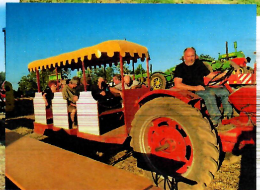
Festival des vieilles mécaniques les 30 et 31 juillet