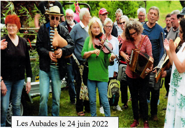
Les Aubades le 24 juin 2022