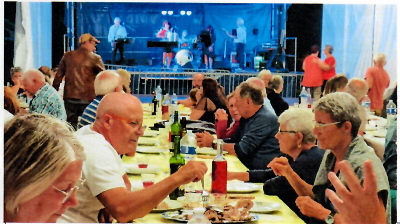
Fête du village : Repas du Comité des fêtes – Bubble Bump