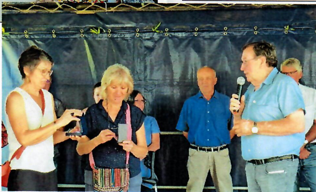
Buffet organisé par la Commune à l'occasion des départs à la retraite des deux salariées le 2 juillet